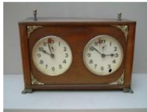
Pendule allemande, boîtier chêne, aux environs de 1930.