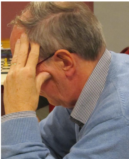
Certains sont ici incognito et se demandent s'ils n'auraient pas mieux fait de rester au Congo... Si, si on t'a reconnu.