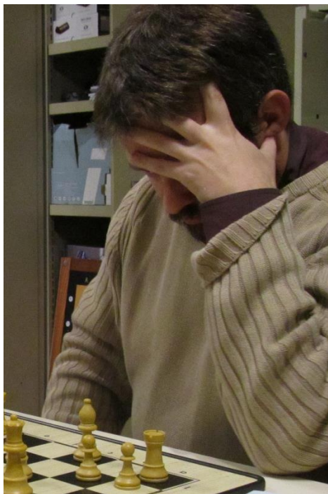
D'autres ne comprennent pas ce qui leur arrive.

Et le photographe ne fera pas de selfie. Bref, tous ont mal joué ! Vivement la seconde manche pour se refaire une santé.